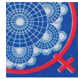
RED DE MUJERES MUNICIPALES DEL PARAGUAY