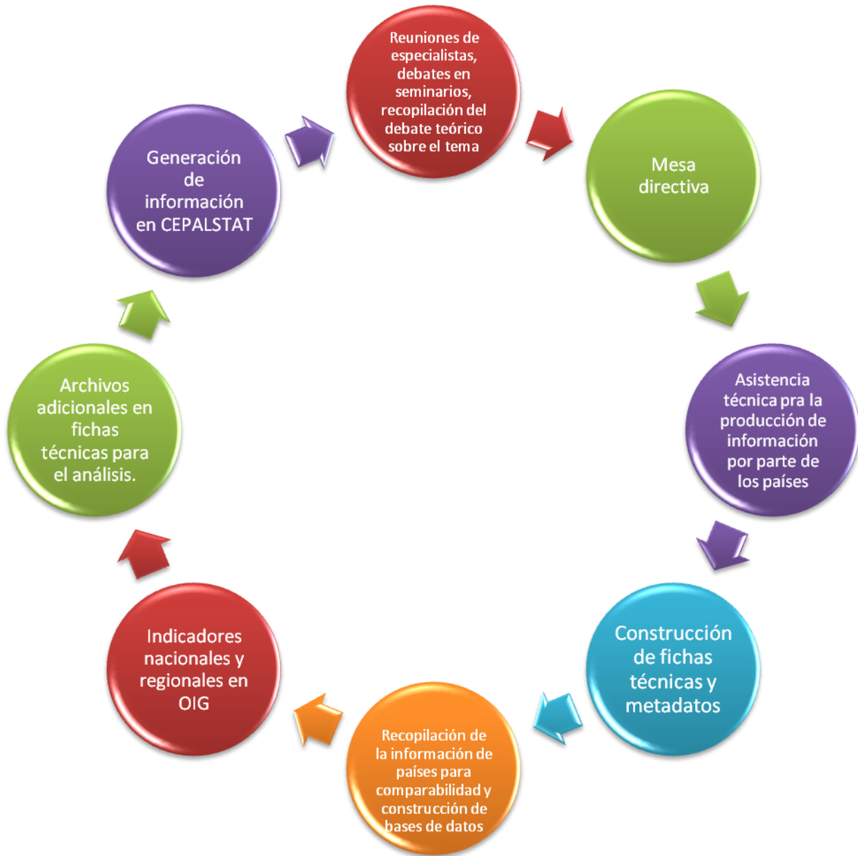
Figura 1: Proceso de construcción de indicadores